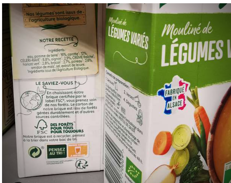
Exemple de valorisation du choix d'emballage FSC.