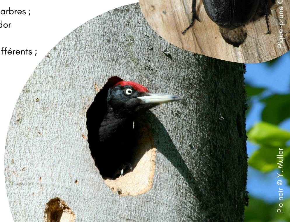
Pic noir