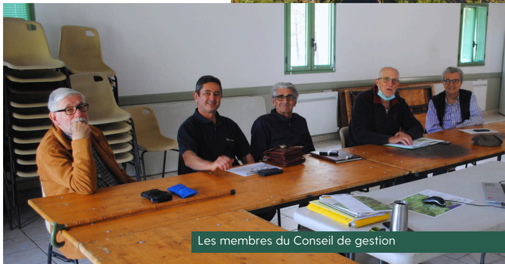
Les membres du Conseil de gestion