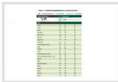
TRADEMARK REGISTRATION LIST

FSC est une marque déposée. Pour savoir quelles symboles de marques (® ou ™) s'appliquent à votre marché, téléchargez la liste des marques enregistrées sur la page "Brandmarks".